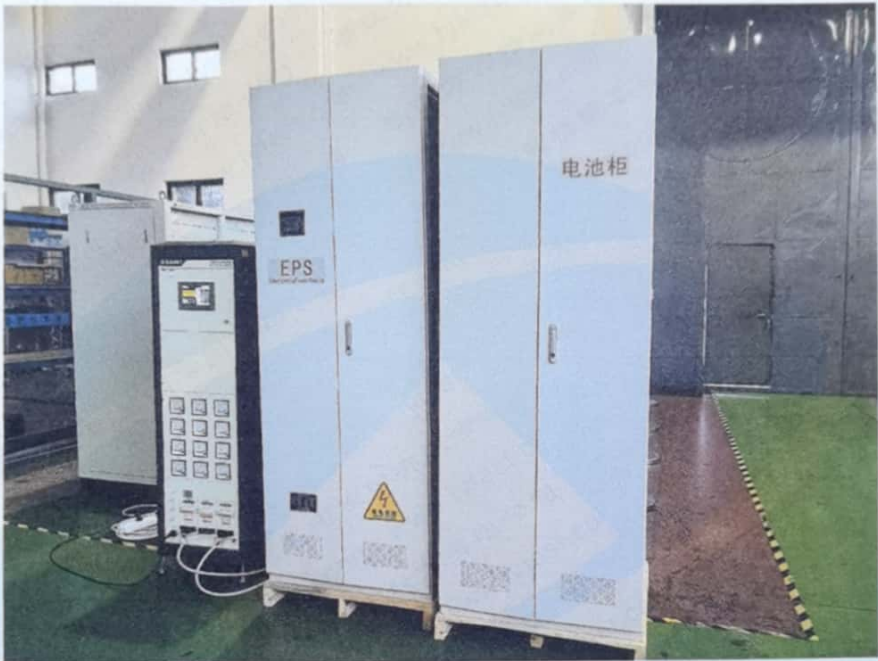
电压暂降、短时中断和电压变化的抗扰度试验