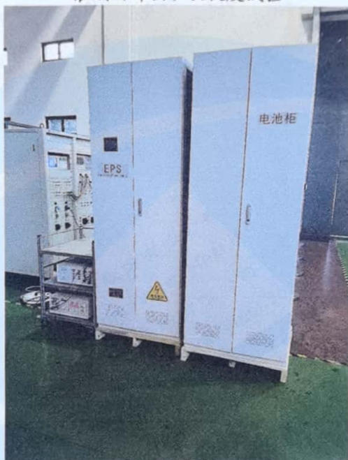
浪涌（冲击）抗扰度试验